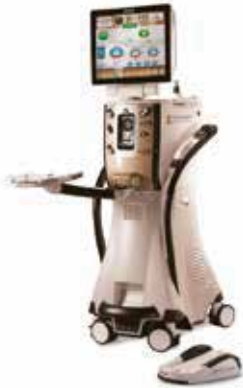
2 Faco Centurion