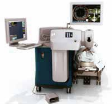
Femtosegundo con LenSx