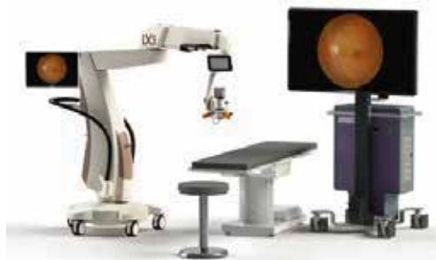
Sistema de cirugía 3D NGenuity