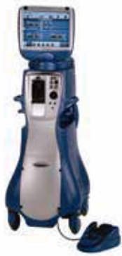
2 Faco Infiniti