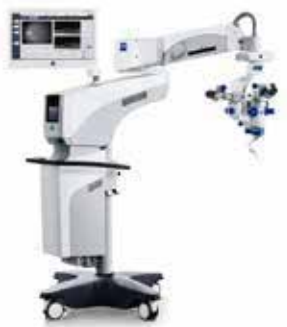
Microscopio Lumera 700