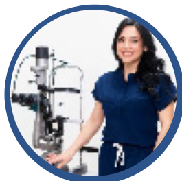
Quirófanos para cirugía de plástica ocular dotados con la mejor tecnología