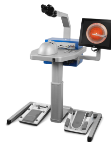
Simulador EyeSi versión