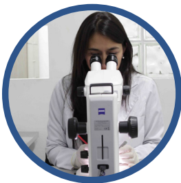
Microscopio para Web - Lab