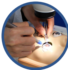
Sistema kitaro para entrenamiento